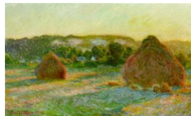
Les meules de Monet

Parce que certains fromages avaient une forme cylindrique semblable à celle d'une meule, on parle à partir du XIII ème siècle de la meule de fromage . Au XVI ème siècle apparaît la meule de foin , en raison de l'empilement cylindrique des gerbes. En Normandie la forme ronde et pressée du beurre a pu inspirer l'usage de meule de beurre par analogie avec la pierre de moulin, et on parle même de meule de tabac pour désigner la boule de tabac à priser.