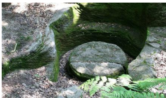
Carrière de meule de grès.

Une cavité circulaire est creusée au pic autour de la pierre choisie pour en faire une meule. Des coins de fer logés dans des emboîtures étroites sont enfoncés et frappés au tétu (un gros marteau conçu spécifiquement pour cet usage) afin de décoller la pierre du banc. Elle est ensuite remontée au treuil avant d'être percée (ou après l'avoir été) en son centre d'un oeillard dans lequel sera enchâssée l'anille , une pièce de fer qui bloquera l'axe du moulin, et par lequel sera versé le grain entre la roue tournante et la roue inférieure, fixe.