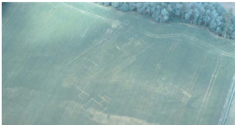
photo aérienne de 1977. On découvre l'emplacement d'une villa romaine près de Richebourg, dont le site n'a pas encore fait l'objet de fouilles