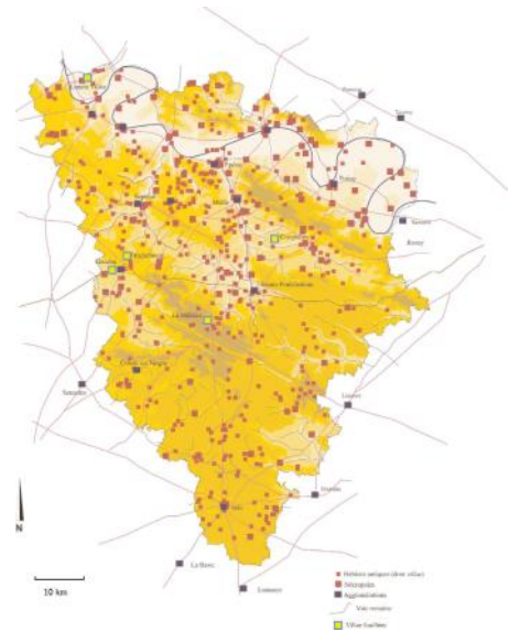
carte des sites gallo-romains et des villas fouillées dans les Yvelines (état juillet 2004). Réalisation :Yvan Barat . publication du Service archéologique du département des Yvelines

Le domaine agricole de la villa était de taille variable, de 2.5ha à plus de 500ha. Elle y cultivait des céréales (surtout du blé et de l'orge), des cultures fourragères et parfois la vigne sur certains coteaux. Elle pratiquait en outre l'élevage.