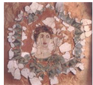
la Fresque de l'été

A la fin des campagnes de fouilles les structures de maçonnerie ont été recouvertes de sable et de pierres pour les protéger des intempéries et du gel en attendant une éventuelle valorisation future.