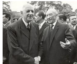
Charles de Gaulle et Konrad Adenauer

Les jumelages avec des villes allemandes ont été plus lents à se mettre en place : il a fallu à leurs promoteurs le courage de braver l'opinion d'anciens combattants ou d'anciennes victimes d'une époque encore récente. Ils sont aujourd'hui les plus nombreux -de très loin- parce que la volonté de réconciliation entre nos deux pays, incarnée par le rapprochement entre Charles de Gaulle et Konrad Adenauer (1959-