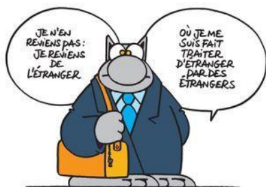
le Chat de Geliück

Les jumelages entre villes sont nés en Europe après la Seconde Guerre mondiale, dans un contexte marqué par la volonté de réconciliation entre les peuples. L'idée était simple mais ambitieuse :