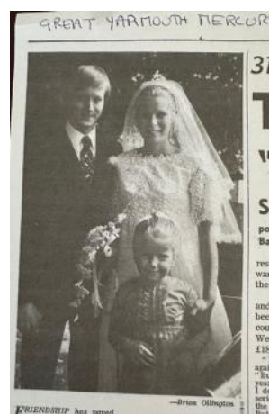
Great Yarmouth Mercury 24/9/1971

Sans entrer dans le détail des rencontres qui ont marqué les premières années de ce jumelage qui est toujours aussi actif, on peut signaler le 8 avril 1964 la visite à Rambouillet de Sir Person-Dixon, ambassadeur de Grande-Bretagne à Paris, à l'occasion d'un échange de jeunes, et pour le 10ème anniversaire du jumelage, celle de Sir Reilly, ambassadeur d'Angleterre.