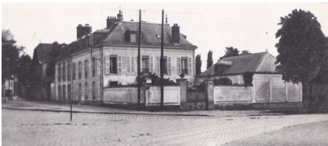
le grand chenil en 1923

Après le transfert de la meute, l'immeuble principal du chenil resta ensuite occupé, à usage de logements, et de dépendances jusqu'en 1923.