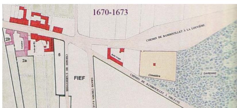
plans de Jean Blecon tirés de son livre « le palais du roi de Rome »

On le distinguait ainsi du Petit Chenil , situé Grande rue, et déplacé par le comte d'Angiviller pour permettre la construction de l'Hôtel du Gouvernement (plus tard Palais du Roi de Rome).