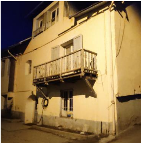
Le Portique à Saint-Chaffrey

En 1962 la ville achète le chalet du « Portique » dans la station alpine de Saint-Chaffrey, à 1km de Serre-Chevalier. C'est la MJC qui peut en profiter la première, organisant 5 stages de ski de 12 jours à des jeunes Rambolitains. Le chalet est équipé pour accueillir 20 personnes, et des travaux sont rapidement budgétés pour augmenter sa capacité d'accueil. Du matériel de ski est à la disposition des stagiaires.