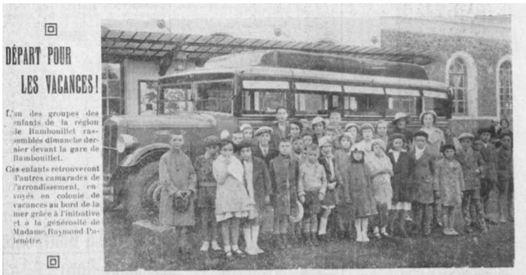
31 juillet 1936

Après la Première Guerre mondiale, l'idée de vacances populaires progresse avec le mouvement de réforme sociale. Quitter durant quelques semaines son cadre de vie habituel pour « coloniser » un lieu différent, c'est le ressort fondamental de la colonie.