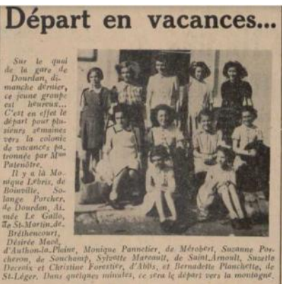
31 juillet 1947

Les colonies se démocratisent. Elles ne sont plus seulement caritatives ou confessionnelles : les CE d'entreprises les utilisent pour renforcer la solidarité ouvrière ; les grandes associations (Ligue de l'enseignement, Francas (Francs et Franches Camarades ),