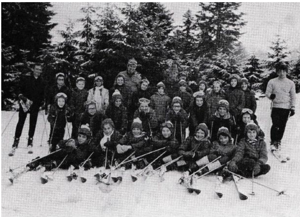
classe de neige de 1971

En janvier 1968, une classe de 30 garçons de La Louvière a suivi un programme pédagogique presque normal, dans un cadre de neige et soleil : classe le matin avec leur instituteur habituel, et ski l'après-midi avec des moniteurs diplômés.