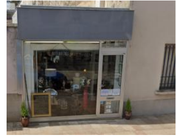
la boutique de X.Bezard