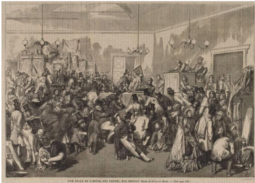
Gustave Doré, Une salle de l'Hôtel des ventes rue Drouot, dans Le Journal illustré , 1866.