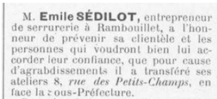
le Progrès de Rambouillet 14 mars 1903

Emile se déplace donc en 1903 au 8 de la rue des Petits-Champs (rue Clémenceau).