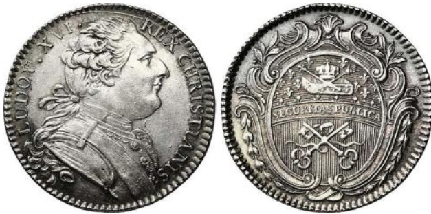
jeton de la corporation des serruriers (Louis XVI au recto)

Le goût de Louis XVI pour les serrures fait partie de la culture historique de tous les écoliers français, avec le vase de Soisson ou la poule au pot d'Henri IV.