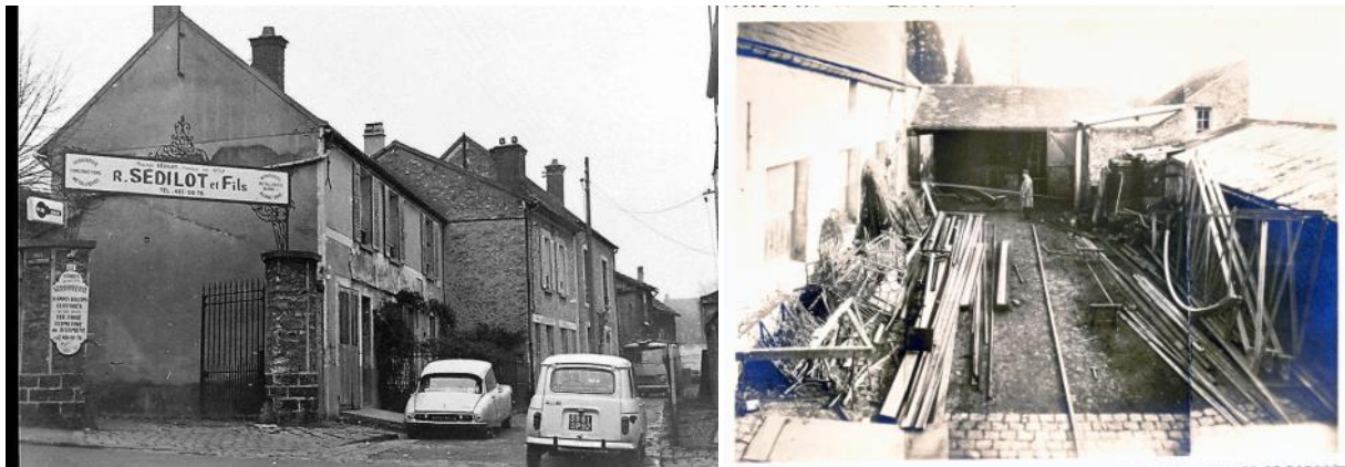
l'entreprise à l'angle de la rue Clémenceau et de l'impasse d'Angiviller et une vue de la cour

Signalons que l'almanach de 1935 situe l'entreprise au 8 rue du Général Humbert . Robert aurait alors repris le fonds du charron E. Devaux recensé l'année précédente à cette adresse ? Je crois plus à une erreur dans la publication.