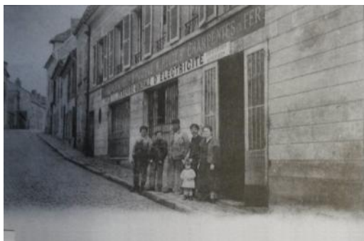
carte postale : l'entreprise Houze

En face, au n°4, la plaque apposée par la SAVRE à la suite de la rénovation de cette maison par la SEMIR rappelle qu'elle a été reconstruite en