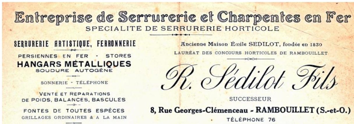
facture 1926