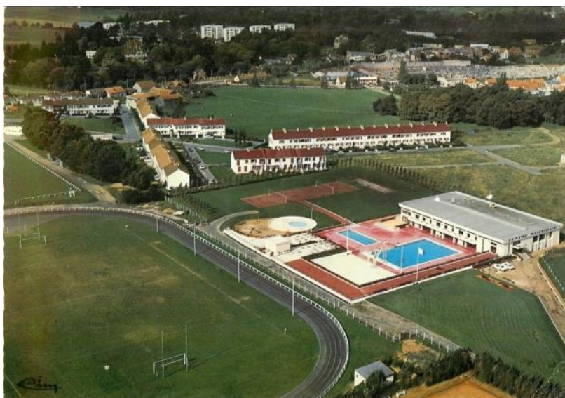
cliché 1968. En haut à gauche : le château du Vieux Moulin, à droite : le cimetière

La presse locale relève que le bassin est éclairé par des hublots étanches qui permettraient de voir immédiatement si un baigneur est en difficulté. Elle salue l'ouverture de « l'un des plus beaux centres nautiques d'Ile-de-France. » (Toutes Les Nouvelles)