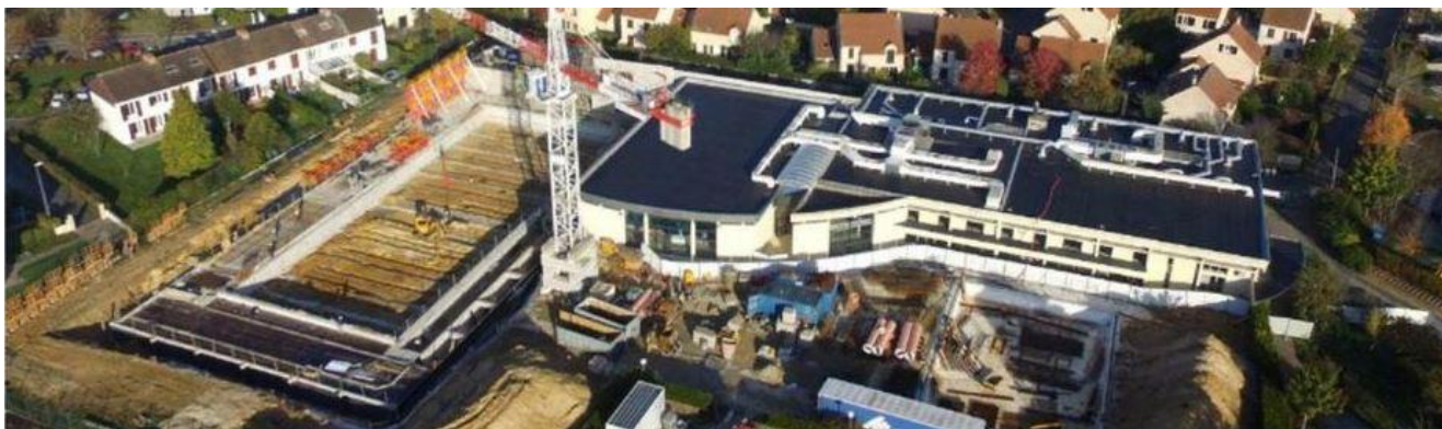
les travaux en cours