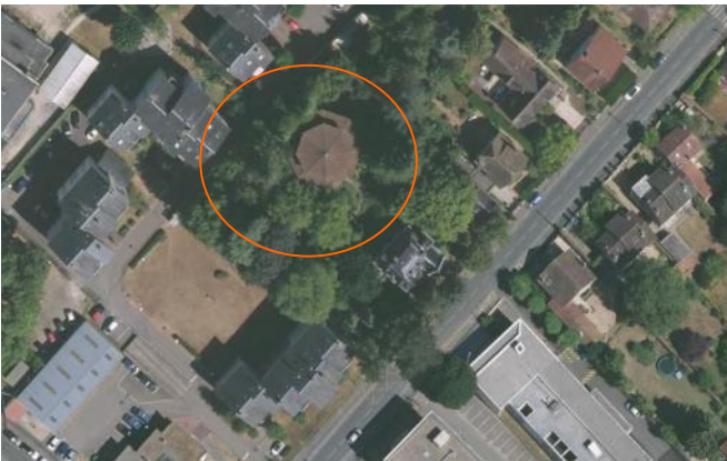
la pagode vue du ciel (Google Map -cliquez pour accéder à la carte)

Tous deux, passionnés de la philosophie et de la culture traditionnelles chinoises, ont fait construire là en 1976 la magnifique Pagode Wan You Lou .