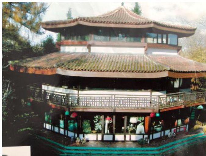
la pagode de Rambouillet